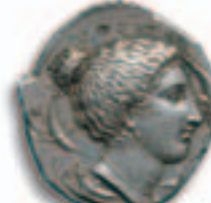
8. SYRACUSE, 405-400. Tetradrachme, argent, etalon attique,

Av. Quadriga au galop à gauche sur une double ligne de terre, conduit par une jeune femme debout vêtue d'un court chiton tenant dans la main droite un flambeau et dans la main gauche les rênes; au-dessus, Niké volant à droite et couronnant la jeune femme; à l'exergue, épis de blé; le tout dans un cercle perlé. Rv. ΣΥΡΑ-ΚΟΣΙΩΝ Tête de la nymphe Aréthuse à droite, les cheveux retenus sur le sommet de la tête par un bandeau, parée d'un triple pendant d'oreille et d'un collier de perles; au pourtour, quatre dauphins; le tout dans un cercle linéaire.