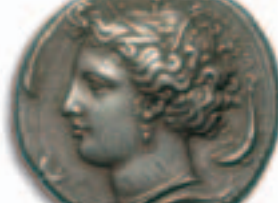
9. SYRACUSE, vers 400 av. l'è.c. Denys I er , 406-367. Œuvre signée du maître graveur euainetos. Decadrachme, argent, etalon attique,

Av. Quadriga au galop à gauche sur une ligne de terre conduit par un aurige debout tenant dans la main droite le kentron et dans la main gauche les rênes; au-dessus, Niké volant à droite et couronnant l'aurige; à l'exergue, panoplie composée d'un bouclier, d'une cuirasse entre deux cnémides et d'un casque. Rv. ΣΥ-ΡΑ-ΚΟΣΙΩΝ / [EY-AINE] Tête de la nymphe Aréthuse à gauche, couronnée de roseaux, parée d'un triple pendant d'oreille et d'un collier de perles; au pourtour, quatre dauphins; le tout dans un cercle perlé.