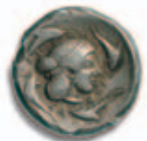
6. SYRACUSE, 485-480. Tetradrachme, argent, etalon attique,

Av. Quadriga au pas à droite sur une ligne de terre, conduit par un aurige debout, tenant dans la main droite le kentron et dans la main gauche les rênes; au-dessus, Niké volant à gauche et couronnant les chevaux; le tout dans un cercle perlé. Rv. Σ-V-PAKOΣION (rétrograde) Tête de la nymphe Aréthuse à droite, les cheveux relevés et retenus par un diadème perlé, parée d'un pendant d'oreille et d'un collier de perles; au pourtour, quatre dauphins.