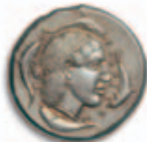
7. SYRACUSE, vers 455 av. l'è.c. Tetradrachme, argent, etalon attique,

Av. Quadriga au pas à droite sur une ligne de terre, conduit par un aurige debout, tenant dans la main droite le kentron et dans la main gauche les rênes; au-dessus, Niké volant à gauche et couronnant les chevaux; à l'exergue, monstre marin à droite; le tout dans un cercle perlé. Rv. Σ-V-PAKOΣION Tête de la nymphe Aréthuse à droite, les cheveux relevés et retenus par un diadème perlé, parée d'un pendant d'oreille et d'un collier de perles; au pourtour, quatre dauphins.